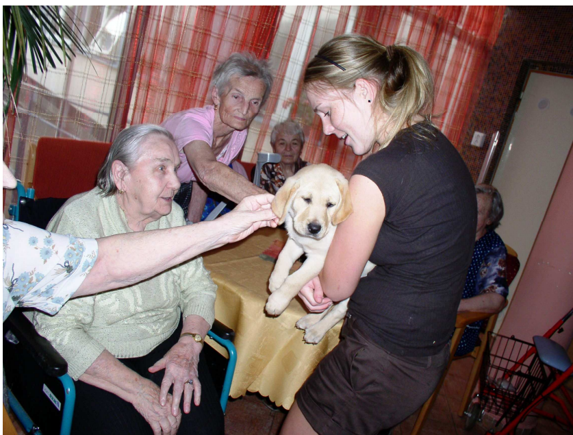
Obr. 25 – Canisterapie

Návštěva psů a cvičitelek je velkým přínosem pro psychickou, ale i fyzickou kondici našich klientů.