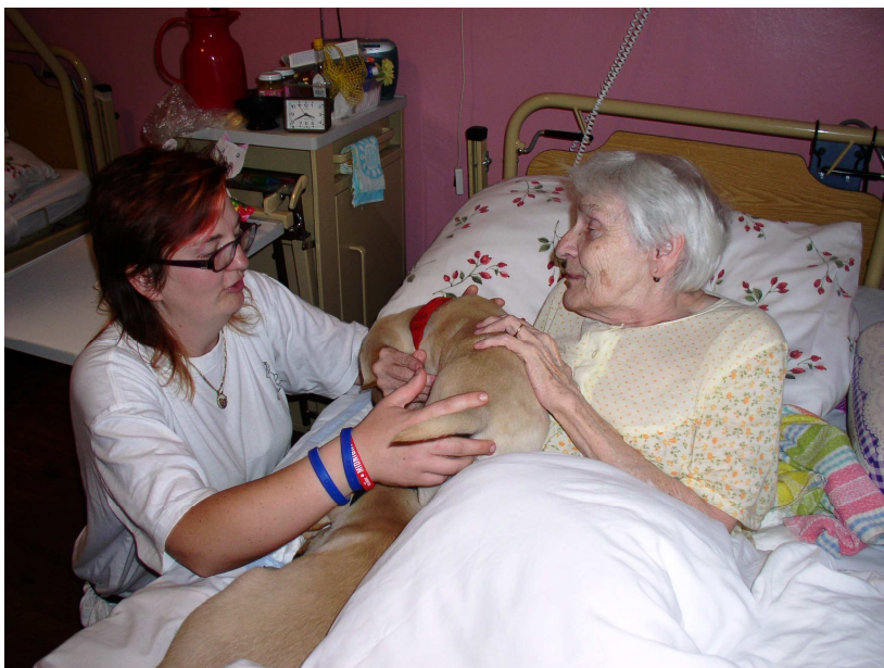
Obr. 26 – Návštěva pejska na pokoji