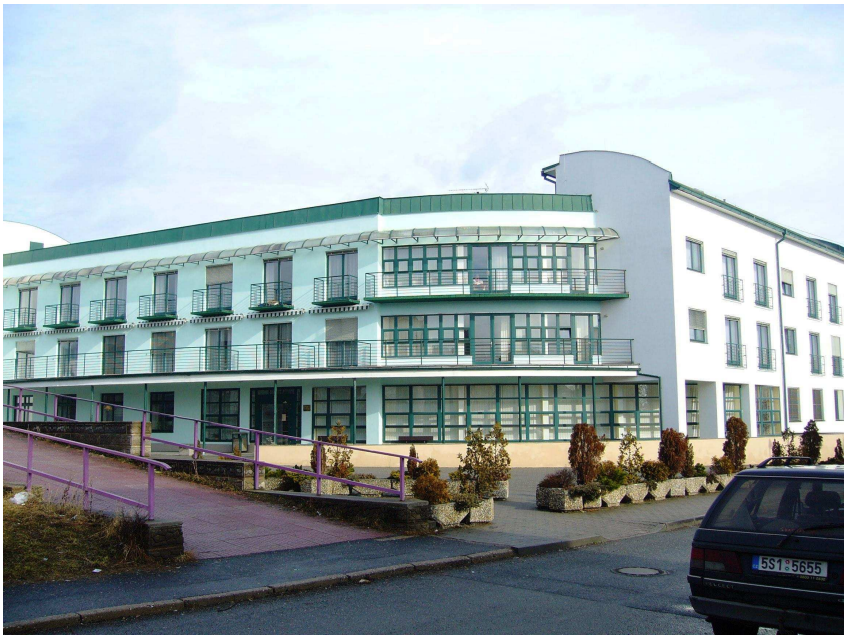
Obr. 33 – Domov seniorů Úvaly

Posláním Domova seniorů Úvaly je poskytování sociálně-zdravotních služeb klientům v důchodovém věku, kteří se ocitají v nepříznivé sociální a zdravotní situaci a potřebují péči a podporu při běžných denních úkonech a ostatních činnostech poskytovaných sociální službou.