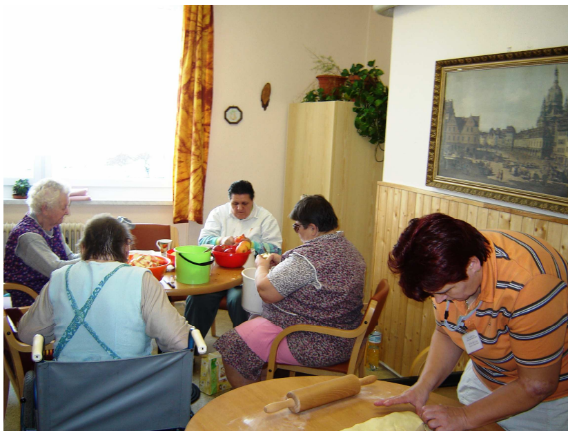
Obr. 12 – Společné pečení

Když jsem se dozvěděla, že je možné zaregistrovat se jako dobrovolník, který bude do domova pravidelně docházet, neváhala jsem a udělala jsem to.