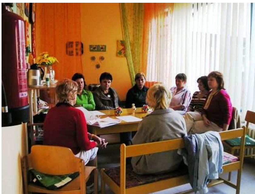
Obr. 16 – Supervize dobrovolníků