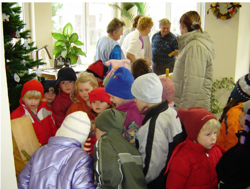
Obr. 10 – Vánoční výstava – setkání obyvatel obce a obyvatel domova na jedné z akcí pořádané domovem

Další dobrovolník je syn jedné klientky, který si velmi oblíbil spolubydlící své matky, a tak si je obě pravidelně bere domů na návštěvu a do Jankova za nimi třikrát týdně dojíždí. Toto je velké zpestření pro naše klienty, protože mají možnost si popovídat s někým zvenčí, čtou, dívají se na televizi a udržují si tak pozornost, soběstačnost a zájem o okolní dění.