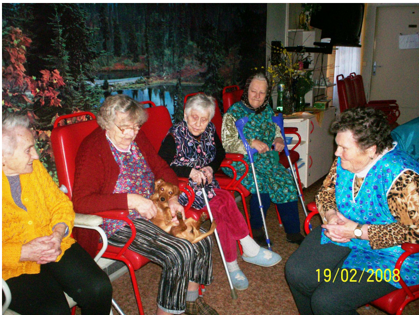
Obr. 8 – Neformální canisterapie v Březnici

Vedle studentů do domova dochází dobrovolnice, která byla dříve zdravotní sestrou a nyní se ze zdravotních důvodů nemůže tomuto zaměstnání věnovat. Pravděpodobně i proto se stala dobrovolnicí v domově. Je z Březnice a díky tomu zná některé klienty domova. Dochází do zařízení dvakrát týdně na cca hodinu, věnuje se klientům dle potřeby a cíleně chodí za pěti z nich, které zná nejvíce. Společně s ní přichází i její pes – labrador, který je velmi přítulný a jehož návštěvy u klientů jsou velmi oblíbené. Díky tomu je její dobrovolnictví obohaceno o neformální canisterapii.