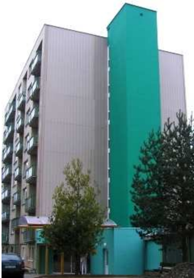
Obr. 29 – Domov Sedlčany

Posláním Domova Sedlčany je zajištění důstojného života seniorům a lidem se sníženou soběstačností v podmínkách blízcích se běžnému způsobu života vrstevníků.