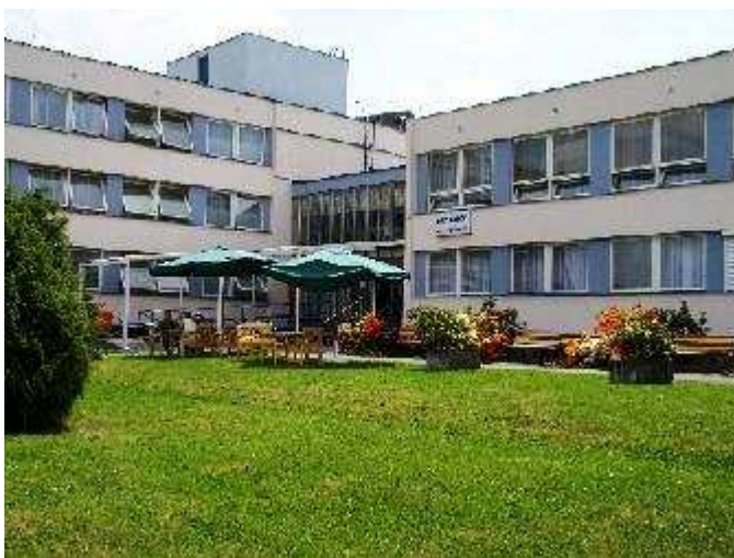
Obr. 24 – Centrum Rožmitál pod Třemšínem

Naším mottem je „Budeme Vám oporou“. Záleží nám na všech našich klientech, kteří si zvolili naše zařízení sociálních služeb za svůj nový domov, aby se zde cítili spokojeně a měli pocit klidu a zázemí.