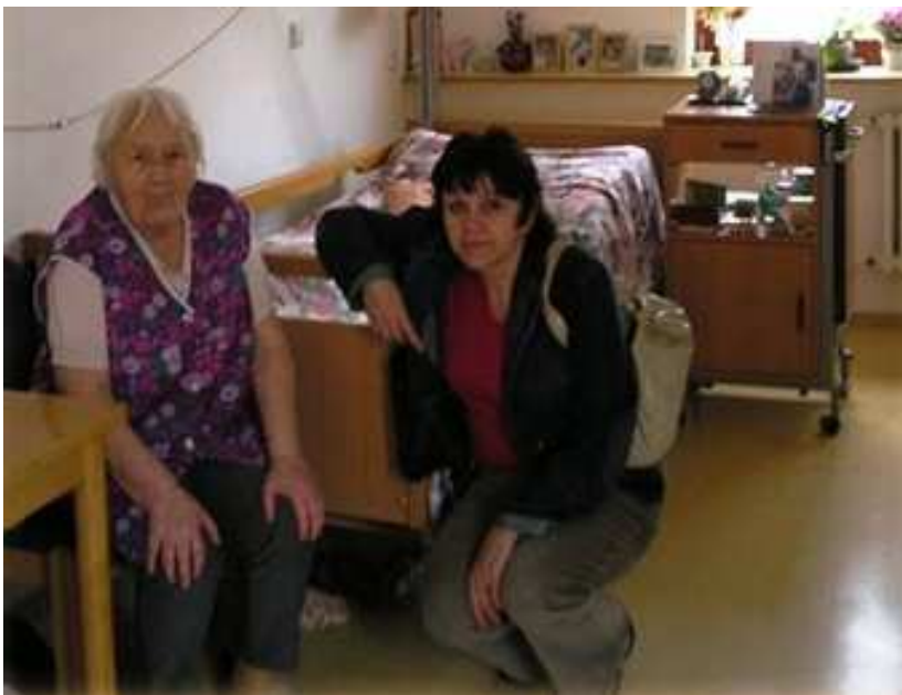
Obr. 15 – Návštěva dobrovolnice

Po absolvování kurzu dobrovolníka jsem začala navštěvovat Dům seniorů společně s psycholožkou, která zde prováděla jedenkrát měsíčně posezení a vyprávění se seniory. Protože se činnost dobrovolníků teprve rozjížděla, nevydržela jsem čekat na přidělení a požádala jsem o doporučení, ke komu docházet. S citlivým přístupem mi koordinátorka vybrala klientku, 83letou babičku, ke které jsem docházela jedenkrát týdně. Má dva dospělé syny, kteří ji často navštěvují. Mohla mít i dcerku, ale jako malé děvčátko jí zemřela.