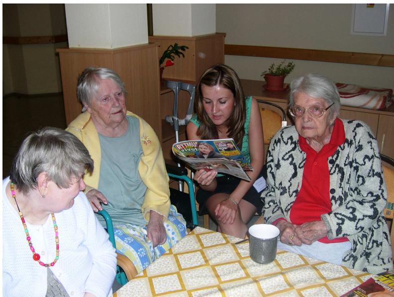
Obr. 3 – Odpolední četba

Z dobrovolnických aktivit převažují v domově dlouhodobé aktivity, dobrovolníci se věnují většinou individuálně klientům, za kterými chodí jako společníci. Některé aktivity jsou vhodné pro celou skupinu klientů například zpívání nebo canisterapie. Jednorázově vypomáhají dobrovolníci s organizací společenských akcí, které jsou v režii domova.