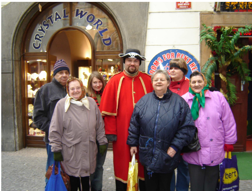
Obr. 11 – Na výletě

Jednou měsíčně dojíždí do zařízení pedikérka, která veškeré služby nabízí našim klientům zdarma.