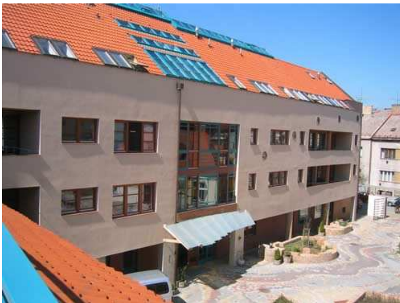
Obr. 14 – Dům seniorů Mladá Boleslav

Posláním Domu seniorů v Mladé Boleslavi je zajištění klidného a důstojného života klientů, kteří vzhledem ke svému stáří a zdravotnímu stavu nemohou žít ve svém přirozeném prostředí nebo rodině. Organizace poskytuje takové sociální služby, aby klienti zůstali součástí místního společenství, dokázali se zpětně začlenit do vztahové sítě a mohli žít běžným životem.