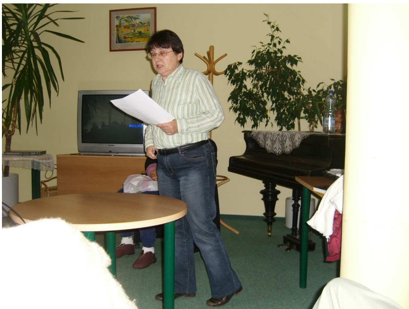
Obr 34 – Historicko-cestopisná přednáška