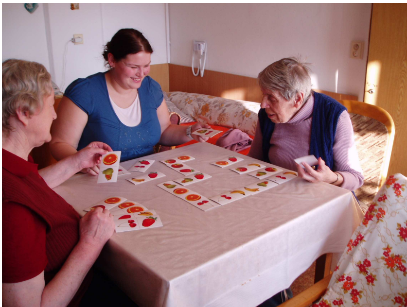
Obr. 23 – Trénink paměti