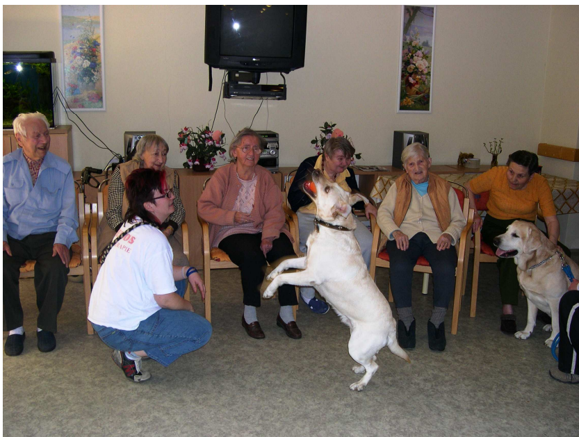
Obr. 4 – Canisterapie