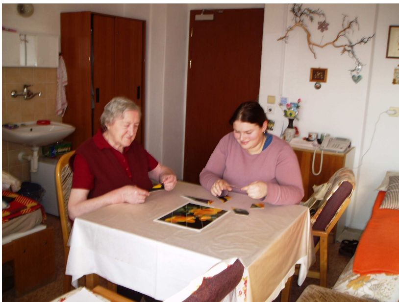
Obr. 22 – Trénink paměti

V dubnu 2007 k nám začala docházet pravidelně dvakrát do týdne. Na svých setkáních s klienty našeho domova předčítala z knih. Velice oblíbené byly knihy s tematikou života populárních herců, které často naši klienti znali i osobně. Po přečtení kapitoly z knihy navazovala spontánní diskuse mezi přítomnými.