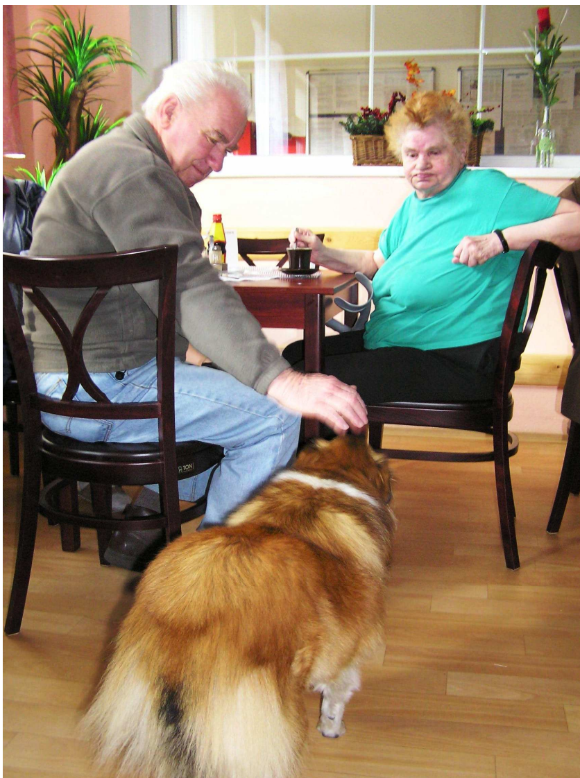
Obr. 37 – Pejsek Andulka v „akci“