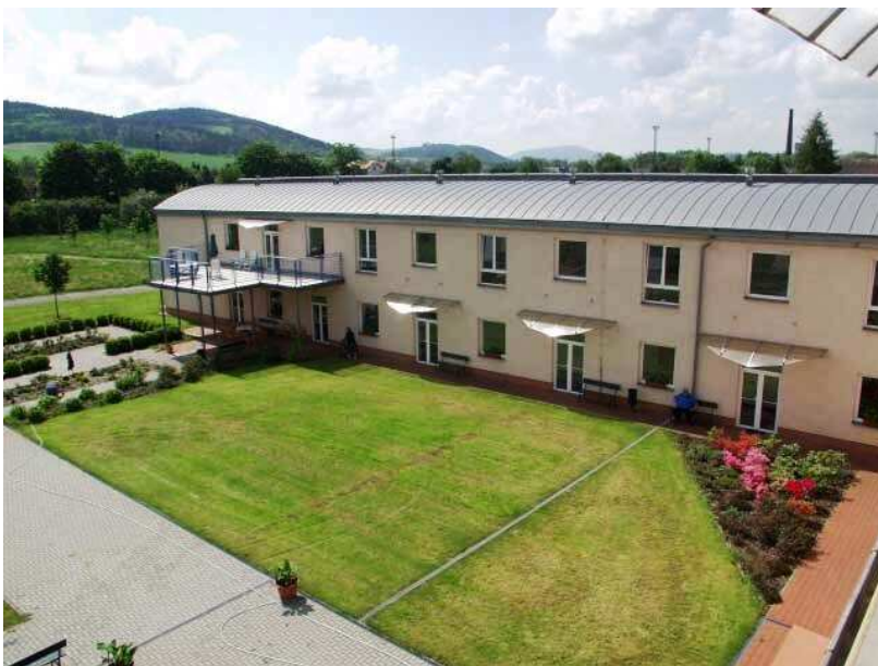
Obr. 27 – Domov V Zahradách Zdice

Posláním Domova V Zahradách Zdice je umožnění prožití klidného, bezpečného a spokojeného života. Pomůžeme při další seberealizaci našich klientů aktivním zapojením do života ve městě a udržením vzájemných kontaktů s rodinou a přáteli.