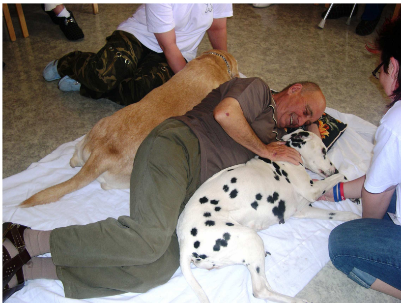
Obr. 5 – Polohování