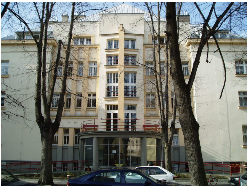
Obr. 20 – LUXOR Poděbrady

Posláním domova pro seniory LUXOR Poděbrady je zajistit důstojné a spokojené žití seniorů v domově pro seniory a vytvořit podmínky v tomto domově co nejvíce blízké běžnému životu.