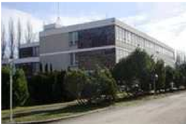
Obr. 6 – Domov Březnice

Posláním domova je podpora zachování nebo zvýšení kvality života uživatelů služeb a umožnění prožití klidného, bezpečného a spokojeného staří formou celoročního pobytu.