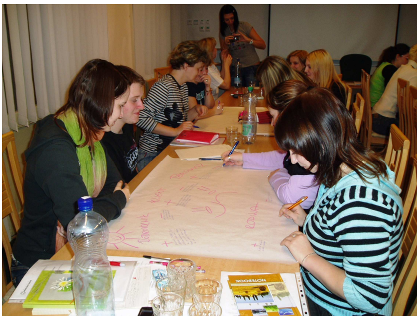
Obr. 21 – Školení dobrovolníků