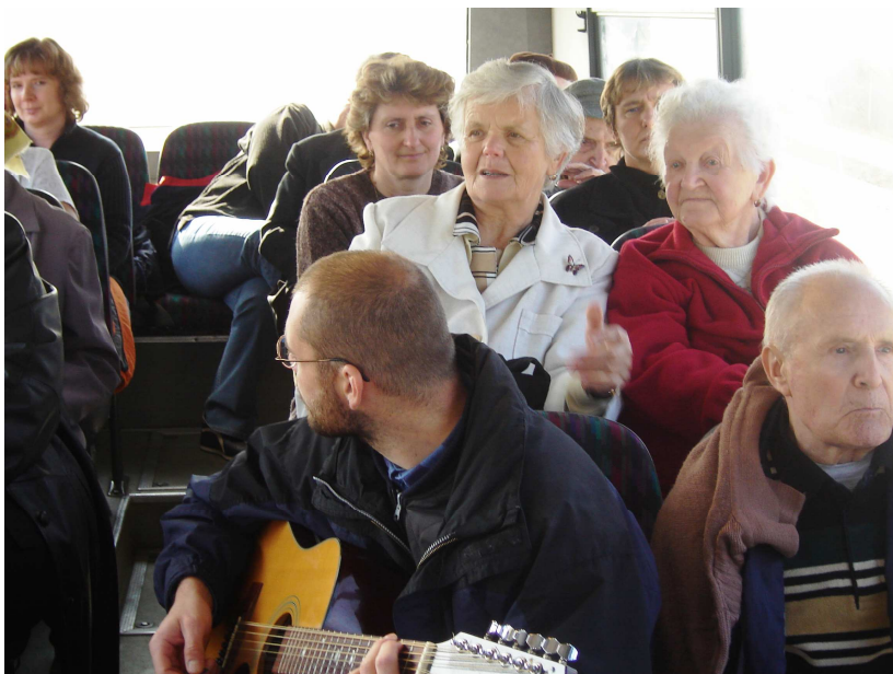
Obr. 13 – Posezení s farářem trochu jinak