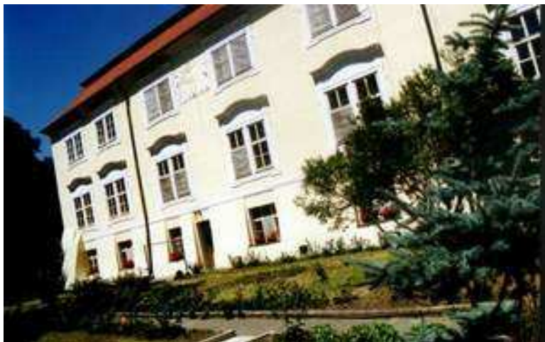
Obr. 17, 18 – Domov Rožďalovice