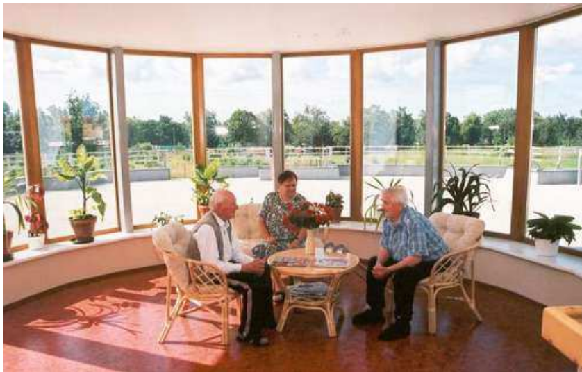
Obr. 2 – Zimní zahrada

V pokojích mají klienti možnost bezbariérového přístupu na balkón a v přízemí mají přístup z pokoje přímo na zahradu. Klienti v podlaží mohou využívat dvě společenské místnosti vybavené kuchyňskou linkou. K příjemnému posezení jsou využívány dvě zimní zahrady, k pracovní činnosti dvě ergoterapie. V přízemí klienti plně využívají společenskou místnost, denní místnost a ergoterapii. Společně klienti využívají knihovnu a společenský sál, kde je soustředěno veškeré společensko – kulturní dění. Věřící klienti se mohou pravidelně jednou týdně scházet společně s obyvateli města Dobříše na bohoslužbách v místní kapli.