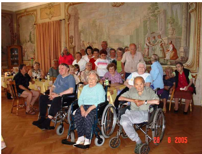
Obr. 19 – Absolventi univerzity volného času

Projekt rovněž přináší možnost propojit obyvatele domova s obyvateli města Rožďalovice. Univerzity volného času se mohou zúčastnit všichni, kdo mají zájem se dále vzdělávat a něco nového se dozvědět.