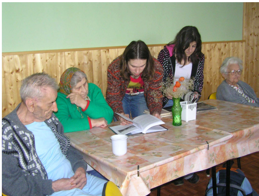
Obr. 32 – Čtení s dobrovolníky