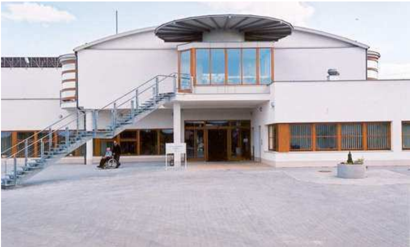
Obr. 1 – Domov seniorů Dobříš

Posláním domova je poskytování odborných zdravotních a sociálních služeb pro seniory a občany, kteří se ocitli v nepříznivé sociální situaci, občany s trvalými změnami zdravotního stavu nebo pro občany, kteří již nemohou dále setrvat v domácím prostředí, a to v podmínkách blízcích se běžnému způsobu života vrstevníků.