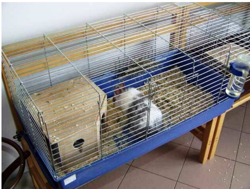
Obr. 28 – Domácí mazlíčci