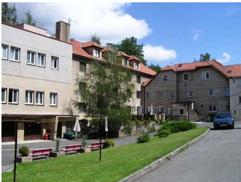
Obr. 35 – Domov Hostomice – Zátor

Posláním domova je podpora uživatelů v soběstačnosti, v dovednostech, v sebeobsluze, v odpovědnosti za své chování, v samostatném rozhodování a seberealizaci, ve snížení sociálního a zdravotního rizika, dále poskytování služeb podle uzavřené Smlouvy o poskytování služeb včetně zdravotně-ošetrovatelských a sociálních individuálních plánů jednotlivých uživatelů, poskytování kvalitní a efektivní služby v souladu se všemi právy, povinnostmi a standardy kvality sociálních služeb, včetně snahy o motivaci uživatele k co nejmenší závislosti na službě.