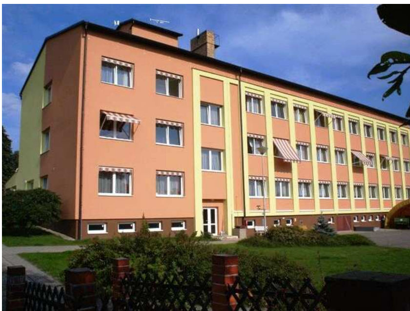
Obr. 9 – Domov Jankov

Základním posláním Domova seniorů Jankov je poskytovat celoročně přiměřenou podporu všem uživatelům obou pohlaví, aby se jejich život co nejvíce podobal životu v běžném sociálním prostředí, s přihlédnutím k míře jejich individuálních potřeb.