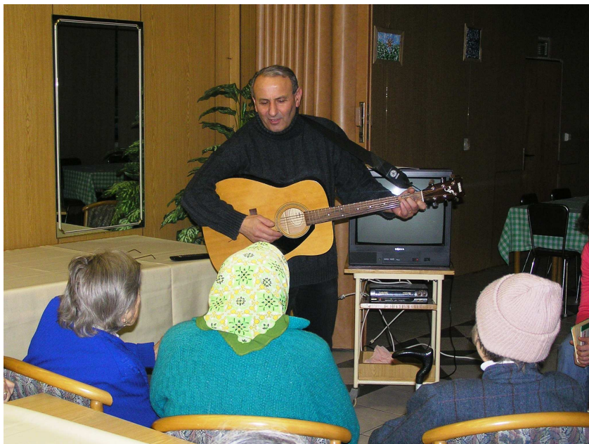
Obr. 31 – Cestování životem

Cestování životem stalo pravidelným a živým klubovým setkáváním s programem, na kterém se mohou podílet všichni účastníci. Je otevřené pro všechny, kteří se chtějí s ostatními podělit o své životní příběhy, zkušenosti a zážitky nebo jen tak posedět v příjemné a přátelské atmosféře. Každé setkání je jiné, dobrovolníci mají vždy připraveno nějaké zpestření, pěkné písničky, hosta se zajímavým vyprávěním či dalším hudebním nástrojem, malé občerstvení, fotografie, video, povídají o sobě, o své práci, svých zkušenostech, ale také naslouchají a přizpůsobují program zájmu klientů.